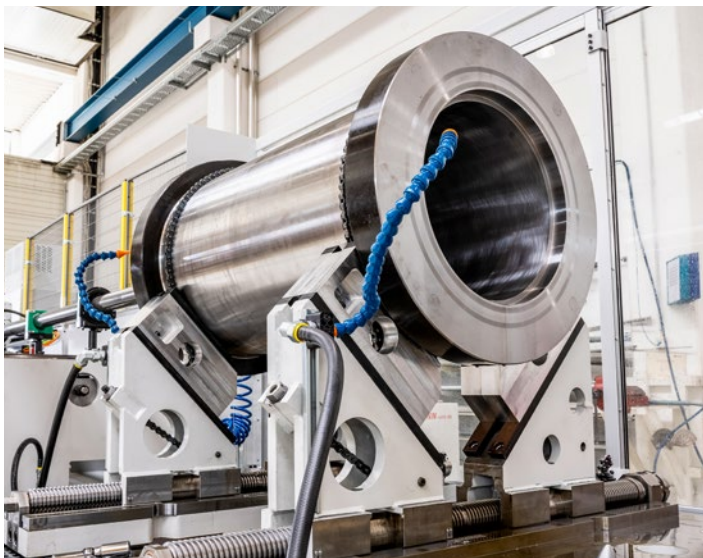
Durchmesserkontrolle der gehonten Laufbuche