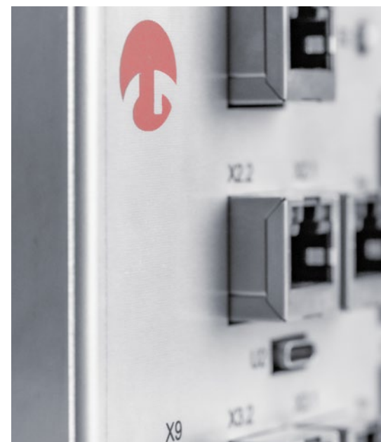
Gearing GCU 3.0

Steigern Sie Ihre Produktionskapazität und verlängern Sie die Lebensdauer Ihrer Maschinen. Willkommen in der Zukunft der Gearing Steuerungstechnologie!